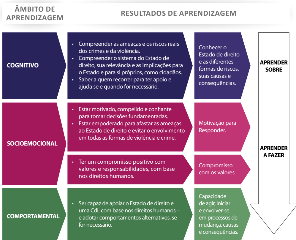
Tabela D. Uma abordagem holística para a promoção do Estado de direito – de “aprender sobre” para “aprender a fazer”