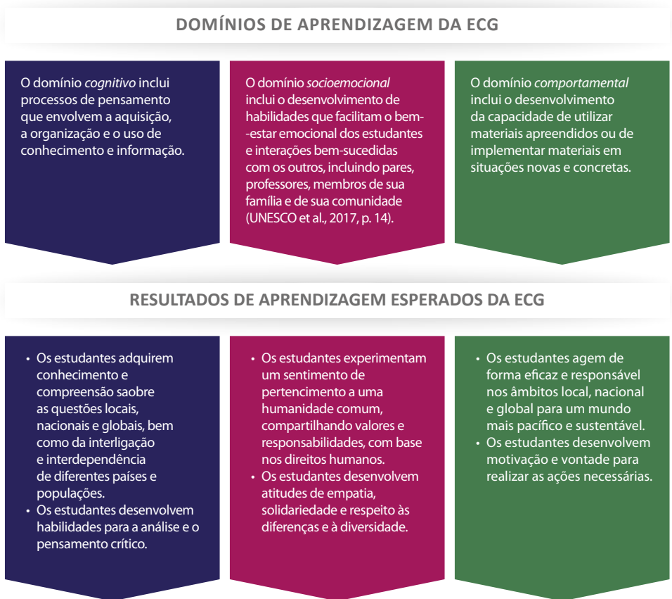
Tabela B. Domínios de aprendizagem da ECG e resultados da aprendizagem esperados

Fonte: adaptado de (UNESCO, 2015, p. 29).